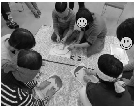
☆お正月レク☆ 福笑いとかるた大会をしました